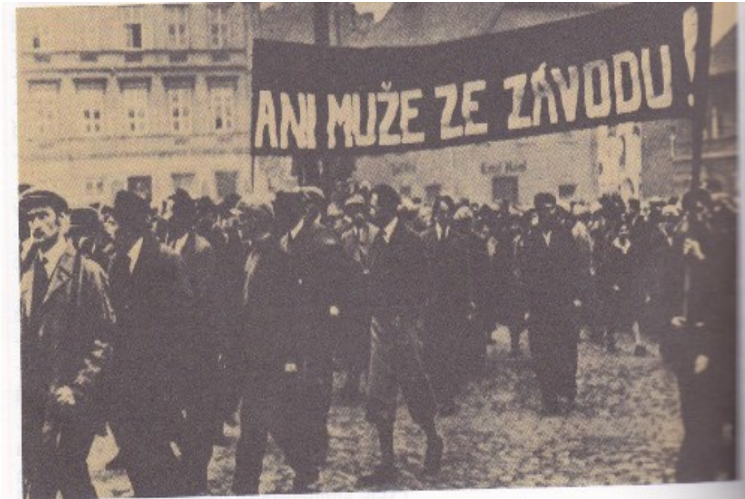
stávka na Mostecku