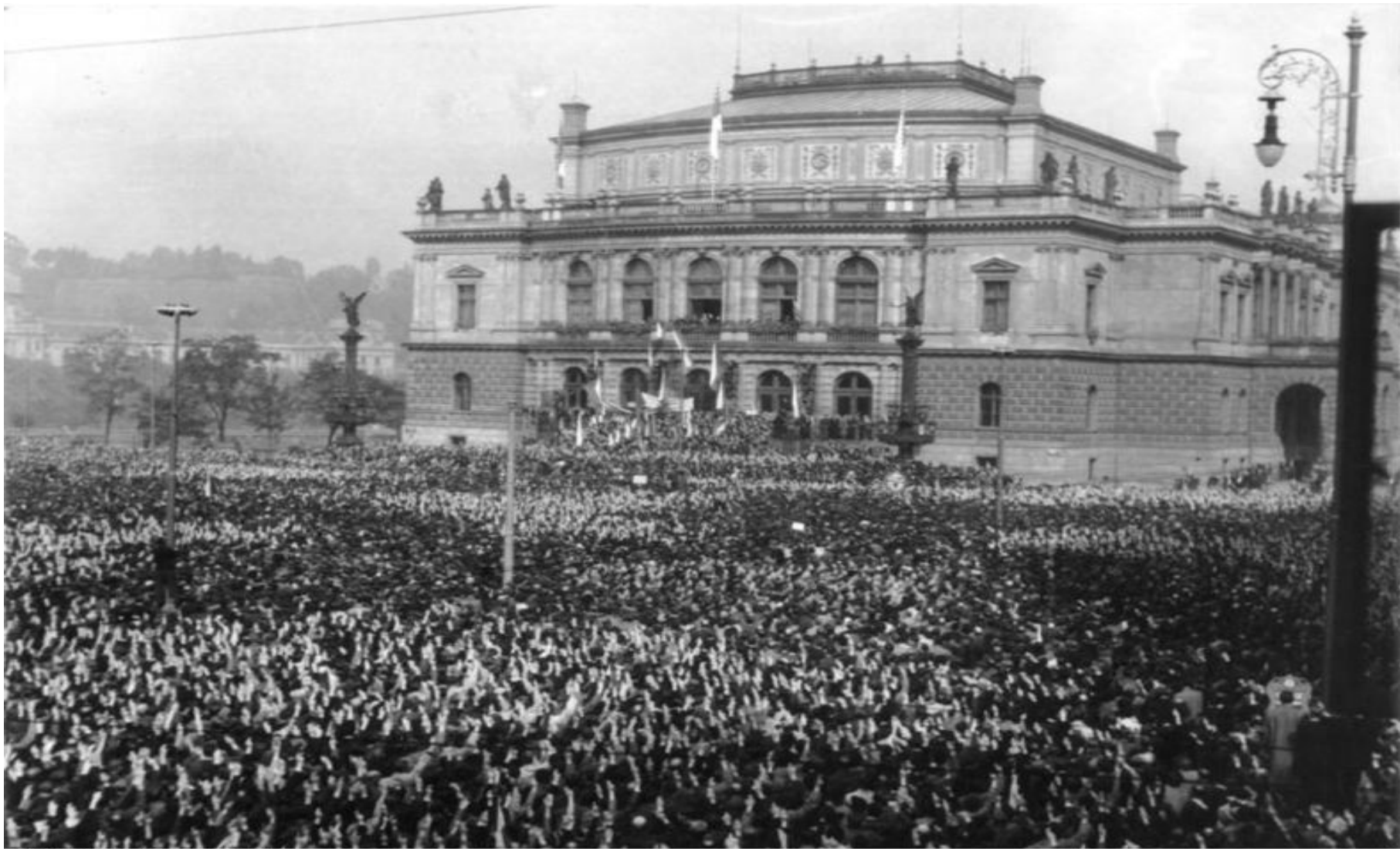
22. September 1938