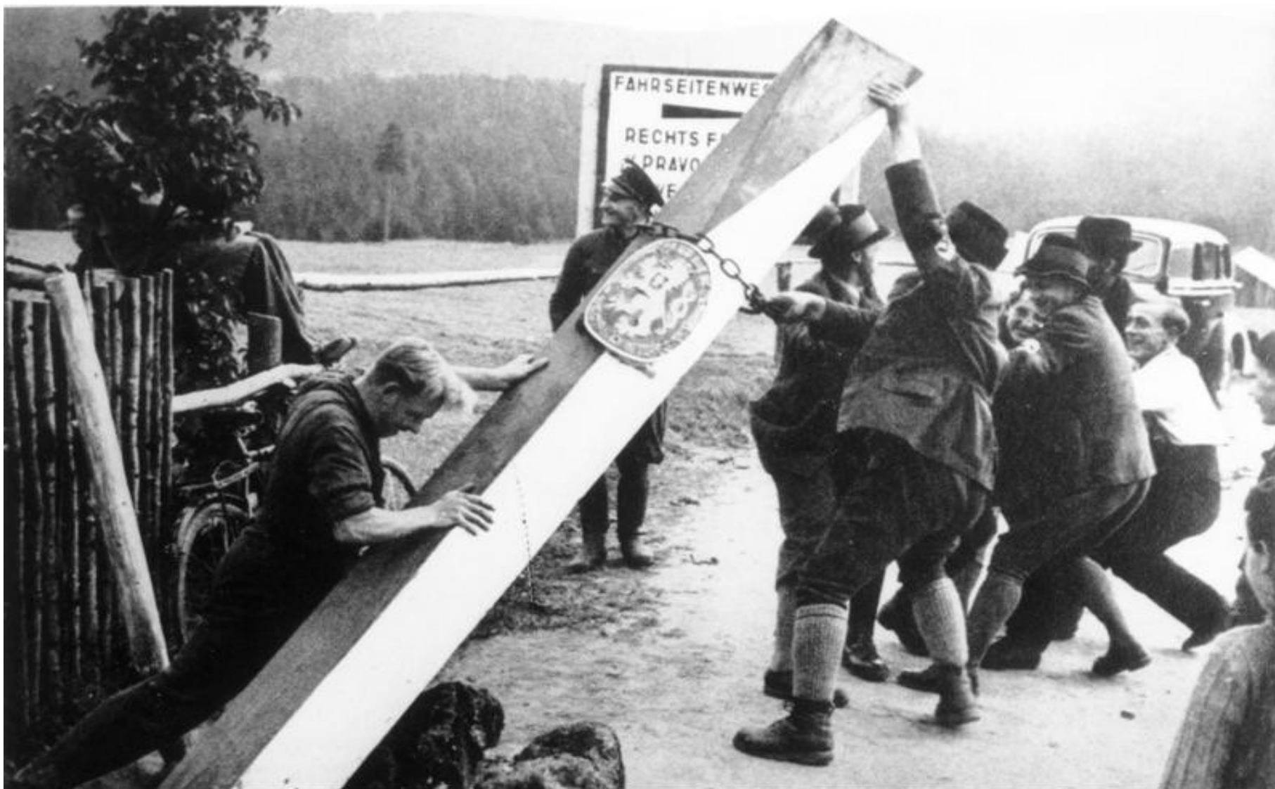
1938 September - Oktober