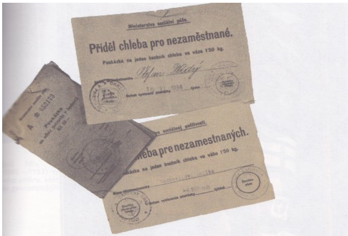
poukázky na potraviny.... z období hospodářské krize 1929-1933