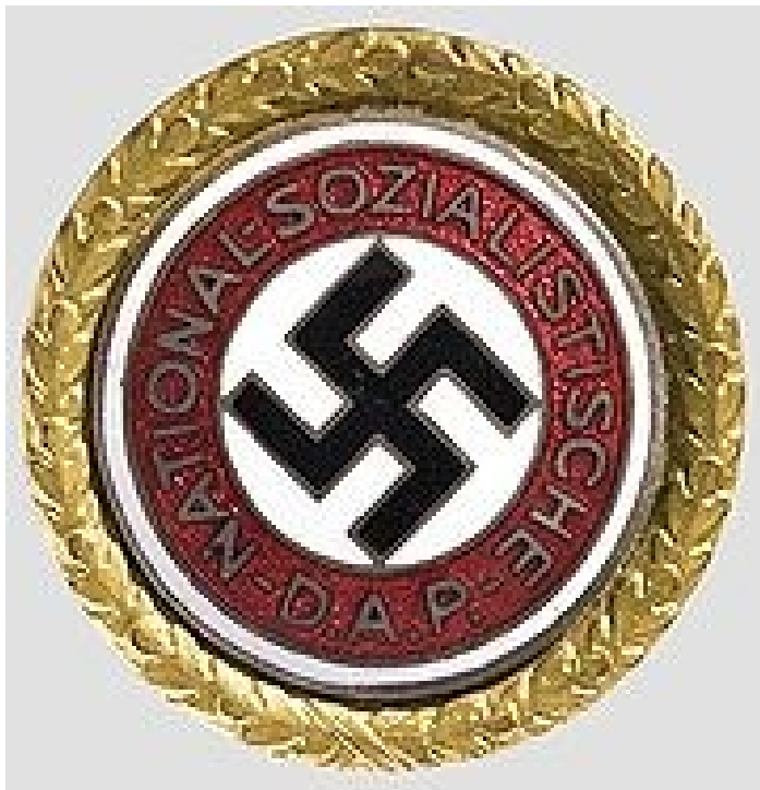
odznak příslušníka strany NSDAP (Národně socialistické německé dělnické strany)